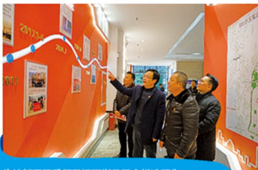
临桂新区工委领导调研指导国企党建工作