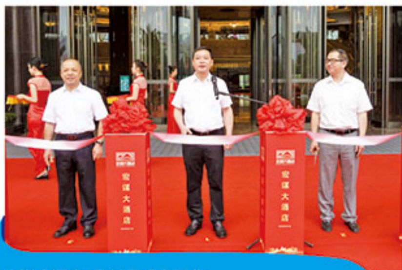
宏谋大酒店5月13日盛大开业