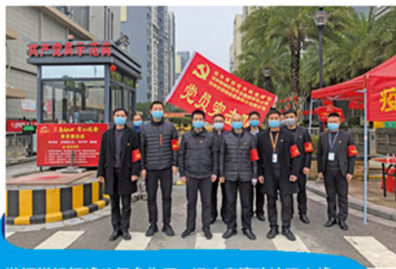
发挥党组织战斗堡垒作用 打响疫情防控阻击战