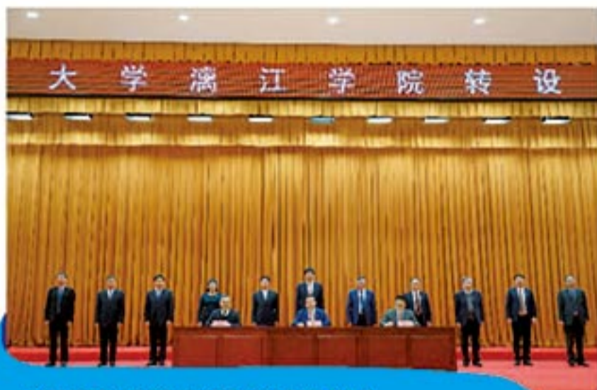
广西师范大学漓江学院转设签约仪式