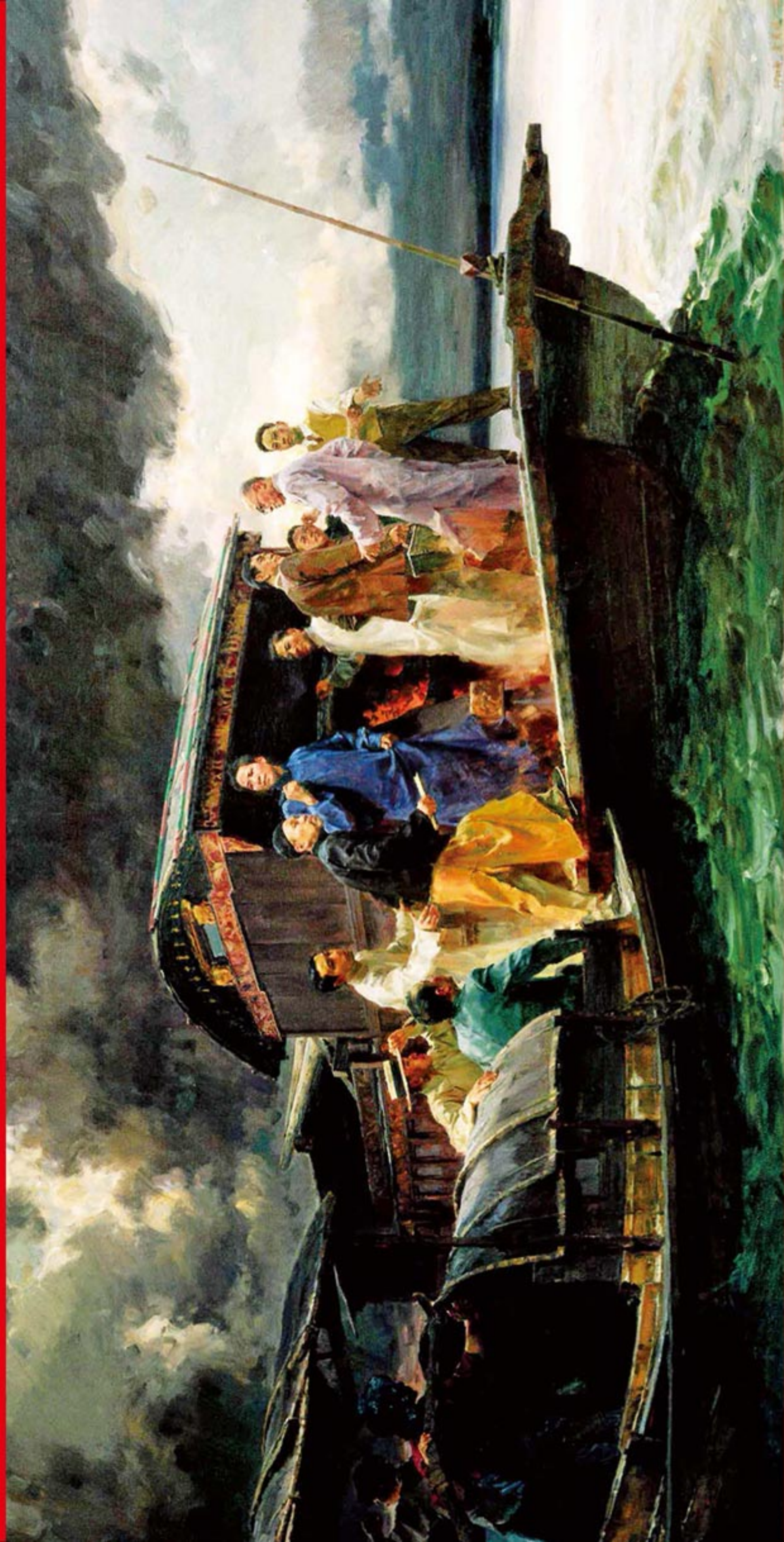
《启航——中共一大会议》 作者/何红舟 黄发祥