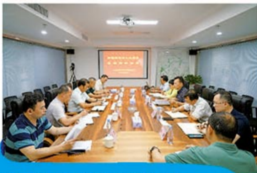
市人大调研组一行莅临新城投资集团开展调研