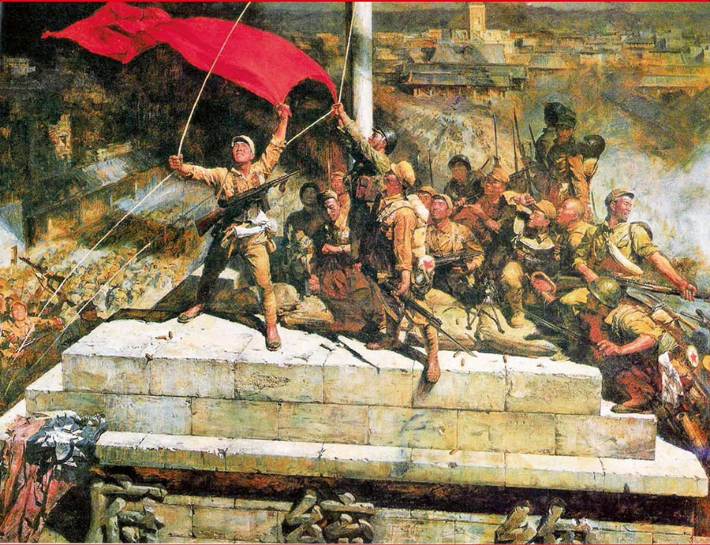
《攻占总统府》 作者/陈逸飞 魏景山

庆祝中国共产党成立100周年 The 100th Anniversary of the Founding of The Communist Party of China