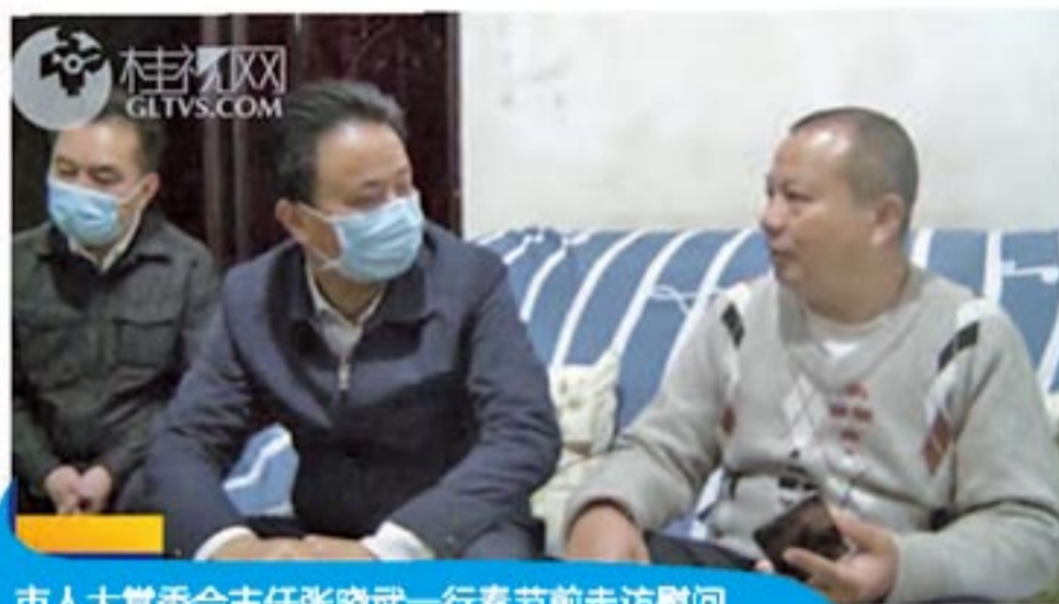
市人大常委会主任张晓武一行春节前走访慰问新城投资集团困难职工